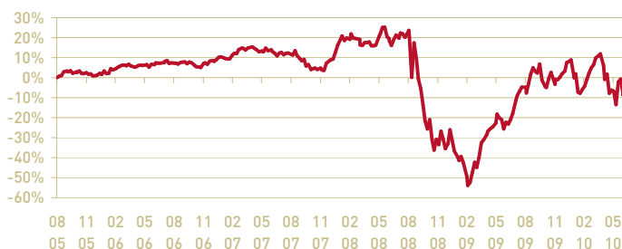
— Okavango Delta FI-A