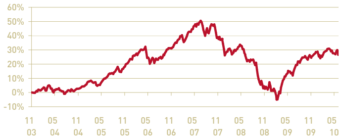
— Abante Patrimonio Global FI-A