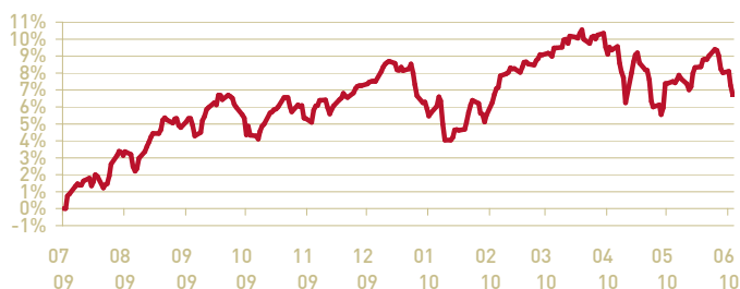
— Abante Patrimonio Global FI-I